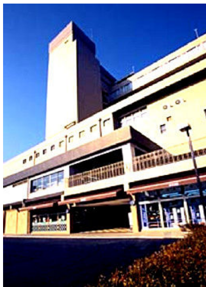
La imagen mostrada sólo es orientativa.

La información de ésta página ha sido publicada de buena fe y se actualiza regularmente; sin embargo GTA no puede garantizar que esté completa y sea exacta. GTA no acepta ninguna responsabilidad de cara a UD o a terceras personas por posibles errores u omisiones en la información proporcionada.