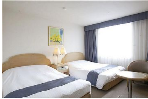
La imagen mostrada sólo es orientativa. Puede alojarse en una habitación distinta a la que se muestra en el ejemplo.